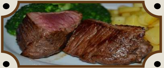
Met slaatje & frietjes/kroketjes,...